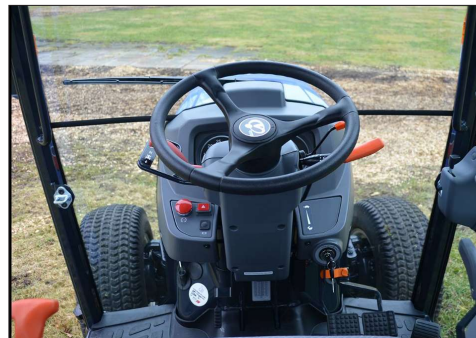
Erinomainen näkyvyys tilavasta ohjaamosta