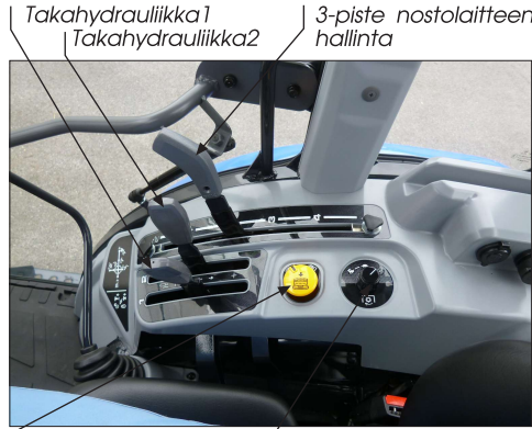
Takahydrauliikka1 Takahydrauliikka2 3-piste nostolaitteen hallinta