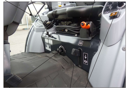
Joystick Joysticklukitus Käsijarru 3-piste laskunopeuden säätö Majakka kytkin Tasauspyörästönlukko