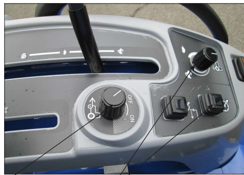
4-vedon kytkin Vakionopeudensäädin muistitoiminnolla Liikkeellelähdön säätö