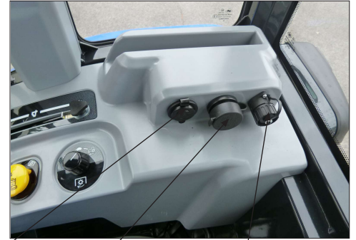
USB-liitin 12V ulosotto Testiportti